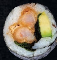
SPICY 9,95 $ Crevette tempura, avocat, laitue, sauce chili sucrée, nori

Peut contenir gluten, arachides et noix. Veuillez nous faire part de toute allergie.