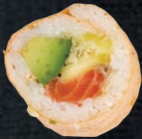
MANGO 9,95 $ Saumon, mangue, avocat, wonton, mayo calif, soya