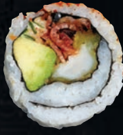
BONSAI 🌶️ 11,45 $ Pétoncles tempura, bacon, tobiko, avocat, oignon vert, mayo calif, épices nanami, graines de sésame, nori