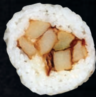
QUÉBÉCOIS 6,95 $ Frites, mozzarella, sauce BBQ, feuille de riz