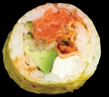
YUMYUM 🌾 9,95 $ Saumon fumé, avocat, concombre, fromage à la crème, mayo fuji, soya, Ruffles assaisonnées

Restez à l'affût de nos promotions et nouveautés