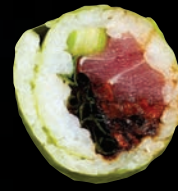
TUNABELLA 10,95 $ Thon, carottes frites, laitue, oignon vert, sauce unagi, soya