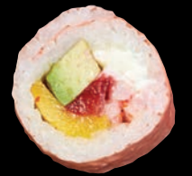
PINK 🌱 9,95 $ Rémoulade de crevettes nordiques, fromage de chèvre, fraise, mangue, avocat, soya