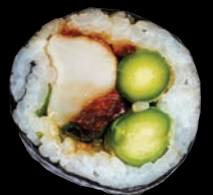
SOHO 11,45 $ Pétoncles grillés, asperge, carotte frite, shitaké sauté, oignon vert, nori