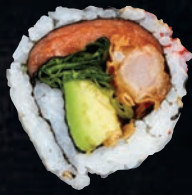
GEISHA 9,95 $ Crevette tempura, saumon fumé, avocat, laitue, mayo fuji, tobiko, graines de sésame, nori