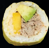
COIN-COIN 10,95 $ Canard confit, mangue, wonton, avocat, mayo calif, soya