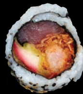
SAPHIR 🌶️ 10,95 $ Crevette tempura, thon, pomme frite, miel, sriracha, nori, graines de sésame