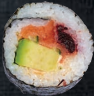
FUJI 9,95 $ Saumon fumé, concombre, avocat, wonton, mayo fuji, sauce canneberge, nori