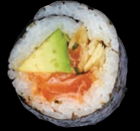
KAMIKAZE 9,95 $ Tartare de saumon, avocat, amandes grillées au miel, wonton, nori