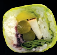
SANTÉ 🌱 🌱 7,95 $ Asperge, avocat, pomme, épinard, fromage de chèvre, sauce canneberge, soya