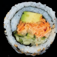
CÔTÉ JARDIN 🌱 6,95 $ Carotte, avocat, concombre, teriyaki, graines de sésame, nori, mayo fuji, wonton