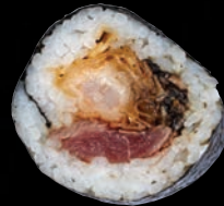
KAIRIKU 10,45 $ Tataki de bœuf, crevette tempura, shitaké sauté, sauce au poivre, nori