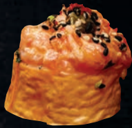
NAGASAKI 11,45 $ Tartare de saumon flambé, avocat, concombre, tobiko, mayo calif, sauce unagi, graines de sésame, soya