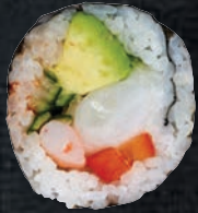
ATLANTIS 🌶️ 🌱 9,45 $ Crevettes tigrées, avocat, concombre, poivron, sauce chili sucrée, sriracha, nori