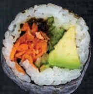
POPEYE 🌱 6,95 $ Épinard frit, avocat, concombre, carotte, miel, nori