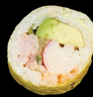
OCÉANIC 9,95 $ Crevettes nordiques, goberge, concombre, avocat, mayo fuji, soya