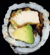
NIPPON 8,95 $ Poulet frit, concombre, oignon caramélisé, avocat, mayo calif, nori, graines de sésame