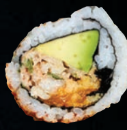
SPIDER 11,95 $ Rémoulade de crabe, mandarine, avocat, wonton, graines de sésame, épices nanami, nori