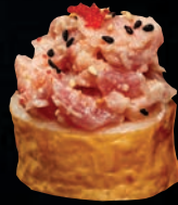
HIROSHIMA 12,45 $ Tartare de thon, avocat, concombre, tobiko, mayo calif, sauce unagi, graines de sésame, soya