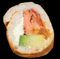
DREAM TEAM 10,95 $ Saumon fumé à chaud, fromage à la crème, mandarine, avocat, wonton, mayo calif, soya